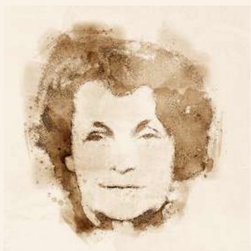
Za izuzetan humanitarni rad u oblasti zbrinjavanja djece siročadi.