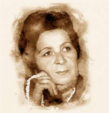
Prva žena rekorderka u prodaji gramofonskih ploča u Evropi.