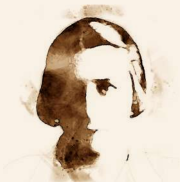
Učesnica Narodnooslobodilačke borbe.