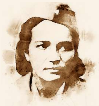
Ljekarka, organizatorica i rukovoditeljica partizanske bolnice u Donjoj Trnovi kod Bijeljine