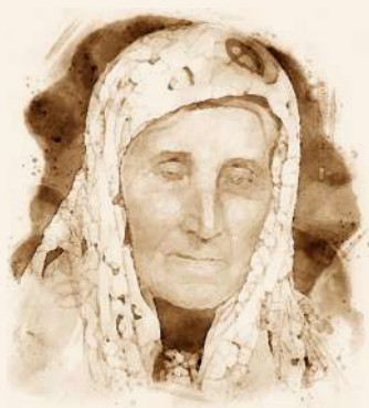
Hatidža Đikić je bila poznata mostarska pjesnikinja.