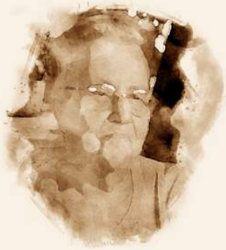
Posljednja višegradska Jevrejka.