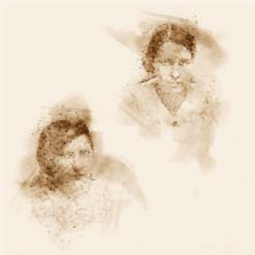
Jedna od dvije sestre Bergman, prve djevojčice upisane u mostarsku gimnaziju i antifašistkinja.